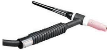
Antorcha TIG de Reemplazo, Weldcraft® Legacy™ 17 #1712RESYLGC #245271 Antorcha TIG de 12,5 pies (3,8 m) con tapa, copa de gas cerámica, 3/32 pulg. (2,4 mm), mordaza y cuerpo de mordaza, y tungsteno ceriado al 2%.