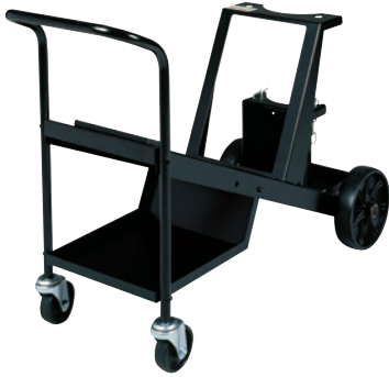
Carros de Ruedas/Portacilindros #770187 Construcción para servicio pesado. Acomoda cilindros grandes y pequeños.